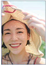
映画監督 安藤桃子氏

ロンドン大学芸術学部を卒業後、ニューヨークで映画作りを学び、2010年「カケラ」で監督・脚本デビュー。14年に、自ら書き下ろした長編小説「0.5ミリ」を映画化し、数々の賞を受賞。その後、高知県に移住し、子ども達との映画作りやアートなど、食育、自然、農を通じ、優しい地域の地場づくりを行なう。23年11月、映画を通じて心と文化を伝える「キネマミュージアム」がオープンするなど、多岐にわたり活動中。父は俳優で映画監督の奥田瑛二さん、母親はエッセイスト、コメンテーターの安藤和津さん、妹は俳優の安藤サクラさん。